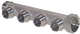
4 Abgänge mit Außengewinde