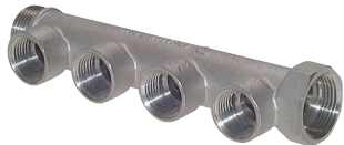
4 Abgänge mit Innengewinde